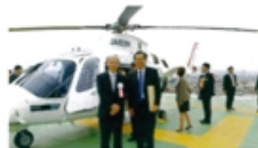
ドクターヘリ運航開始式