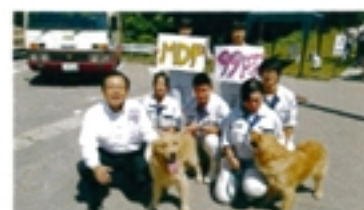
中央農業高のモンキー犬と