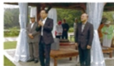
パークゴルフ大会