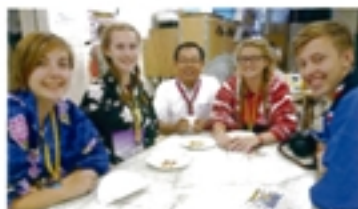
イギリススカウトと交流