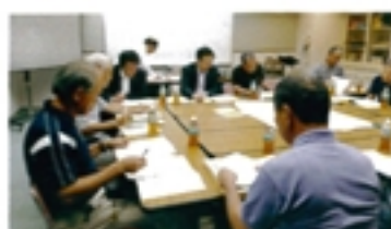
自治振興会要望にて