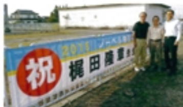
梶田先生横新幕設置